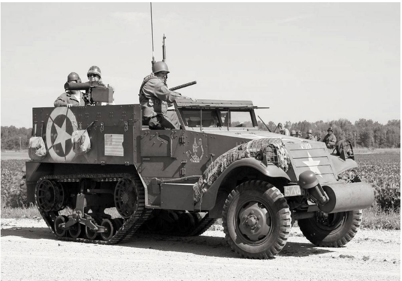
M3 Half-track américain

Du 12 au 14 avril, c'est au tour de Gundelbach, de Horrheim, au pied de la forêt noire, et de Langensteinbach d'être prises. Le 16 avril, Eisenbach, Allmandle et Gottelfingen sont prises sans grande résistance, tout comme Wittensweiler le 17.