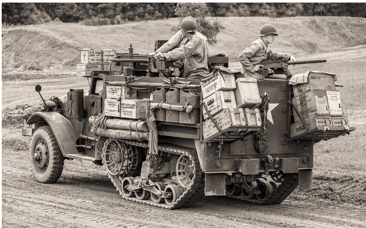
M3 Half-track américain