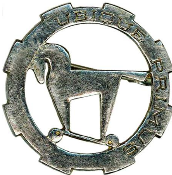
La devise du 1er RCA : UBIQUE PRIMUS (Partout premier)