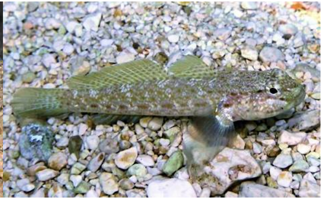
Gobie de Bucchichi