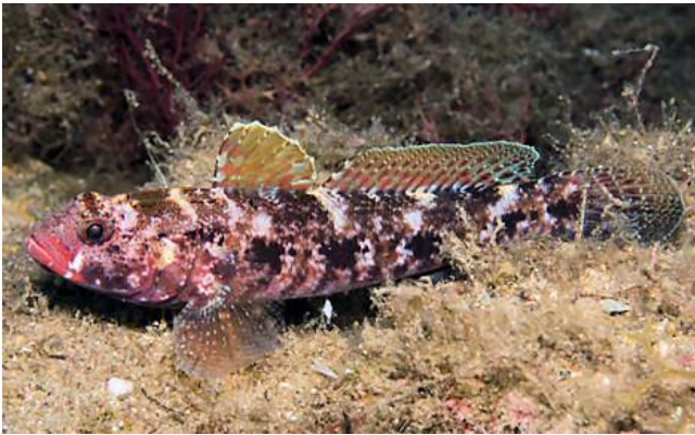
Gobie à bouche rouge